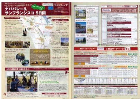
【H.I.S.サイドウェイズ公式ツアーパンフレット】