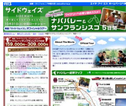
【H.I.S.公式ホームページにて、サイドウェイズ特設ページ】