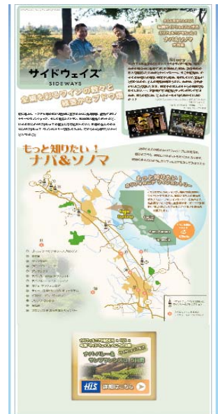
【カリフォルニア州観光局ホームページ特設サイト】